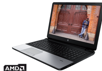
HP 355 (Ref.: JOY64EA)

HP Care Pack 3 años de garantía con asistencia a domicilio al día siguiente (Ref.: UK703E) PVP 110€. Ver promoción HP Care Pack 3 años de garantía TRAVEL con asistencia al día siguiente (Ref.: UL653E) PVP 155€ Promoción 60€