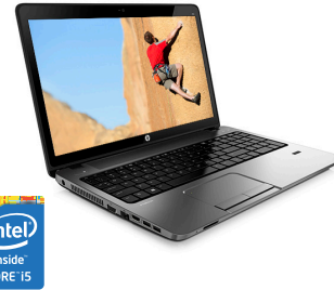
HP ProBook 470 (Ref.: G6W54EA)