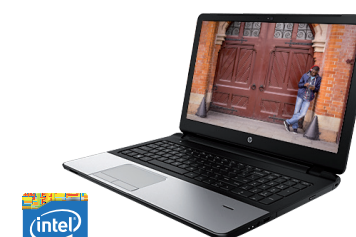
HP 350 (Ref.: F7Y98EA)