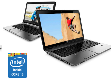
HP ProBook 430/450 (Ref.: G6W08EA / J4S16EA)