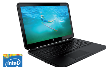
HP 250 (Ref.: JOY18EA)